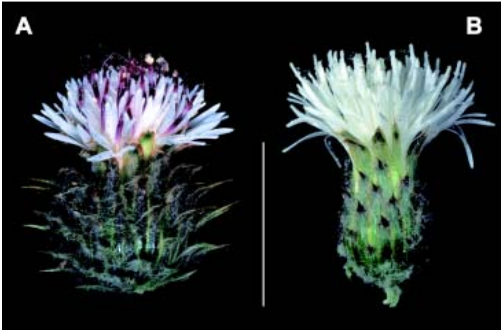
Fig. 2. Comparación entre los capítulos de C. baeocephalus (A) y Carduus volutarioides spec. nov. (B). Escala gráfica = 1 cm.